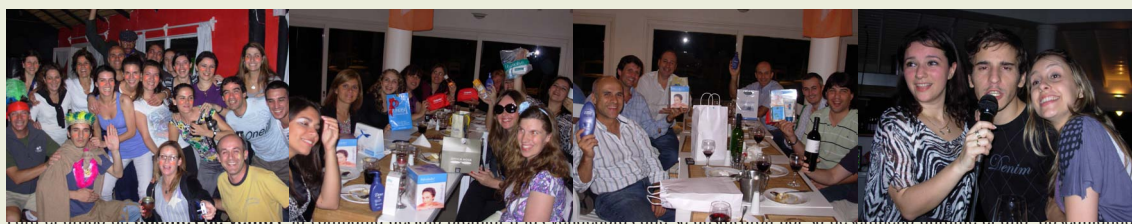
Para el grupo de Agencias de Punta del Este, la compañía decidió premiar a las funcionarias que se destacaron por su desempeño durante el año, obsequiándoles una Netbook a cada una. FELICIDADES!!! Y por un mejor 2010!!

Con motivo del cierre del año, los funcionarios de Blue Cross & Blue Shield de Uruguay compartieron un fin de semana en el Complejo Solanas de Punta del Este. Durante el mismo se realizó una jornada recreativa con humor, deportes y esparcimiento. Se realizaron sorteos y como cierre compartieron una cena en donde el baile, el karaoke y la buena onda se adueñaron de la noche. Justos festejos para un exitoso 2009!!